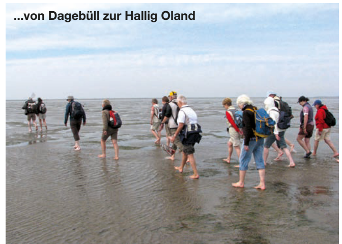
...von Dagebüll zur Hallig Oland