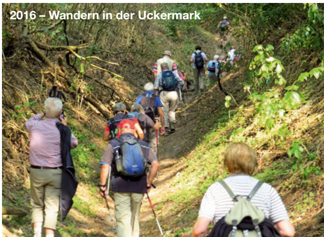
2016 – Wandern in der Uckermark