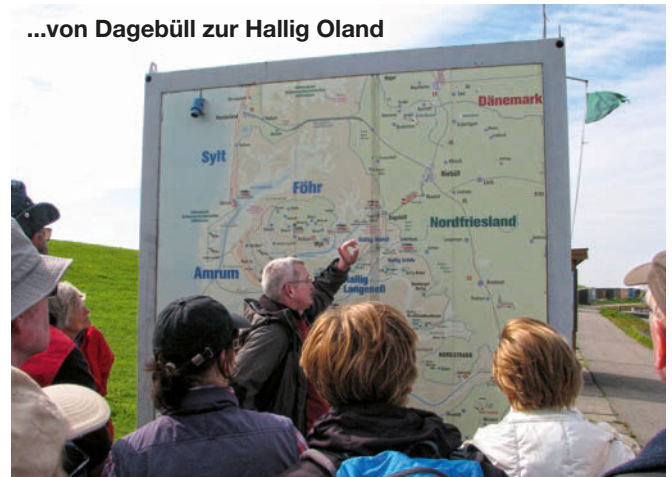
...von Dagebüll zur Hallig Oland