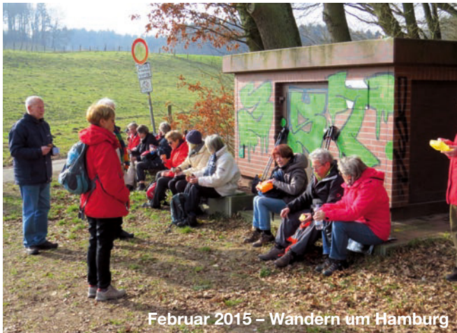
Februar 2015 – Wandern um Hamburg