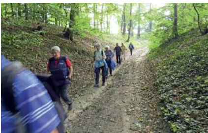
in der Rummel