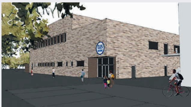
So könnte das neue Sportzentrum aussehen

Die Verhandlungen zwecks Sanierung und künftiger Nutzung für Sport, Kultur und den Stadtteil in der ehemaligen Schule Berne zwischen der fux eG und der Stadt Hamburg sind noch nicht abgeschlossen. Vom Verhandlungsergebnis hängt ab, ob wir, wie vorgesehen, das komplette Erdgeschoss in der Lienaustraße werden nutzen können. Der Vertrag zwischen der fux eG als Betreiber und uns soll im Sommer dieses Jahres im Detail verhandelt werden. Ziel ist ein langfristiger Nutzungsvertrag bei dem wir mit den Betriebskosten belastet werden, jedoch keine Miete fällig wird. Ein Umzug erfolgt erst nach der Sanierung, bis dahin werden wir unser altes Vereinszentrum nutzen.