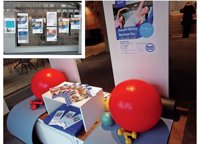
Das Schaufenster direkt neben der großen Bushaltestelle am U-Bahnhof Farmsen

Von Februar bis Ende März hat der tus BERNE in der HASPA in Farmsen eine große Werbekampagne veranstaltet. Wir haben das Schaufenster schön dekoriert mit einigen Sportgeräten und durften über zwei große Schaufenster hübsche bunte Plakate unserer laufenden Sportangebote aushängen. Die Werbekampagne ist sehr gut angekommen und wir konnten damit gut auf unseren Verein aufmerksam machen. Wir danken uns bei der HASPA für diese großartige Möglichkeit!