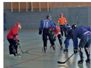
Freundschaftsspiel gegen Walldorfer SV

möchte man diese Spiele auch gewinnen, was aber nicht das Wichtigste sein darf. Es sollte der Spaß und die Fairness im Vordergrund stehen.