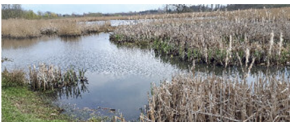
Im Moor an der Trave bei Bad Oldesloe