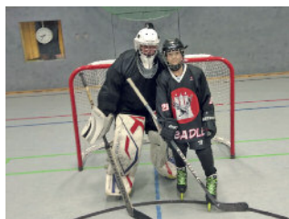
Wie der Papa #78(l.) so der Sohn #29 (r.)

Da wir keinem Ligabetrieb angehören, planen wir immer wieder Trainingsspiele gegen andere Hobby-Mannschaften. Natürlich