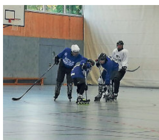
Training bei den Elbadlern