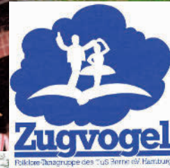
2007 - Ungarn

Und auch ein paar Tänzerinnen der ersten Stunde schwingen noch immer Dienstag für Dienstag das Folklorebein. Wir sind gemeinsam älter geworden, haben teilweise unserem eigenen Nachwuchs die Begeisterung für die Folklore und das Tanzen in die Wiege gelegt und haben Freunde (oder Partner*innen!) fürs Leben gefunden! Über allem stand immer der Spaß am gemeinsamen Erleben – und wir haben VIEL zusammen erlebt.