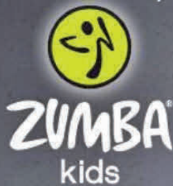
Esteban Carvallo Sportlehrer & Fitnesstrainer

Interesse? Einfach zur Probestunde vorbeikommen!